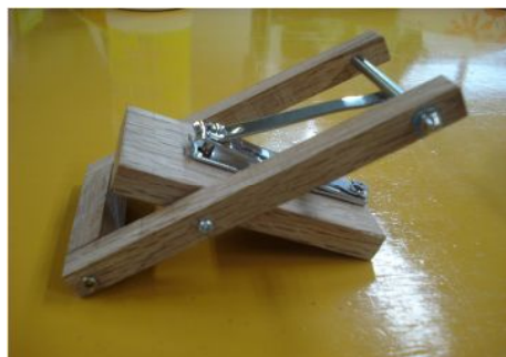
片手で使える爪切り