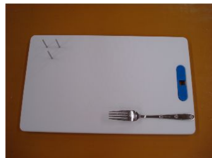
食材を固定できるまな板