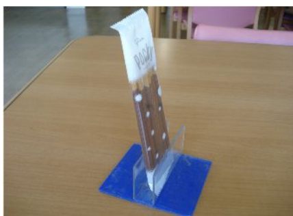
薬の袋等を固定する道具

病気やけがにより不自由になったお体でも、病前に行っていた動作が行えるように、自助具の検討や作成を行っています。一部紹介します。